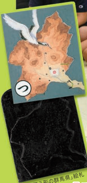
「つる舞う形の群馬県」絵札