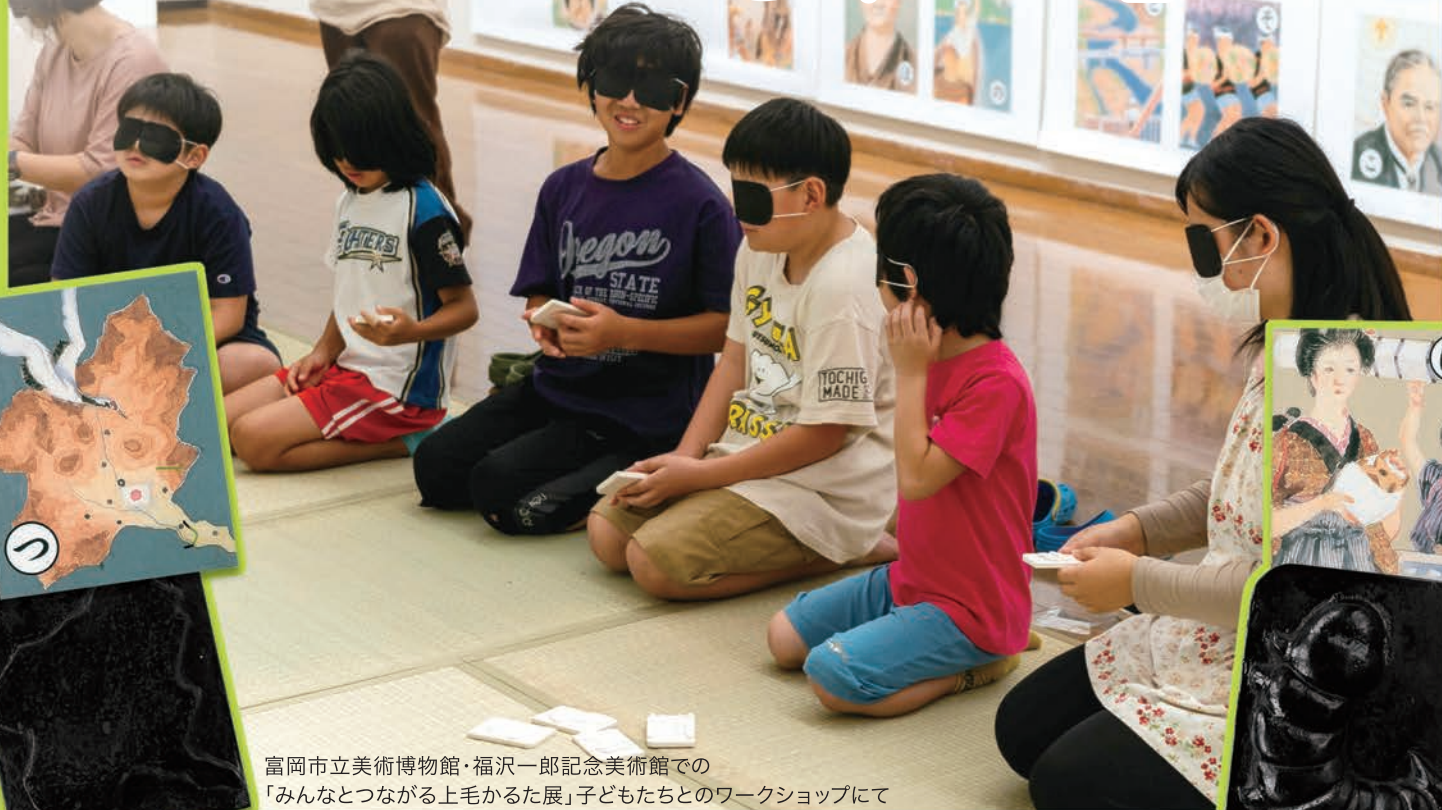
富岡市立美術博物館・福沢一郎記念美術館での「みんなとつながる上毛かるた展」子どもたちのワークショップにて