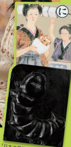
「日本で最初の富岡製糸」絵札